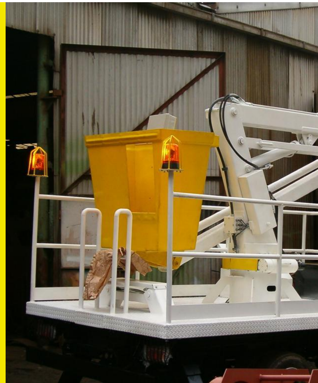
vista de canastillo